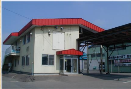
購買部 生産資材事務所